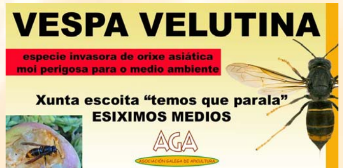
Pancarta manifestación abelleira (Ferrol, 8/10/2014)

1.4.- Colaboración con entidades afíns.- Toda canta persoa vexa o que esta acontecendo coa degradación do medio ambiente, da súa saúde e da nosa propia debe facer un esforzo por evitalo. Non chega con participar en AGA, temos que chegar a mais sectores polo que a participación activa en outras asociacións e necesario para chegar a opinión pública e tratar de cambiar as cousas. Os sistemas productivos han de estar en harmonía coa natureza, por ser o único camiño viable cara a garantir un futuro saudable para as vindeiras xeneracións.