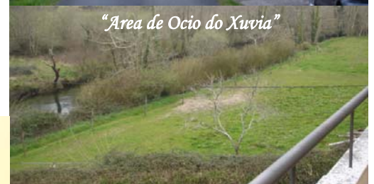
"Área de Ocio do Xuvia"