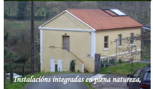
Instalacións integradas en plena natureza,